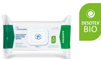
DESCOCEPT SENSITIVE WIPES