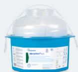
ONE SYSTEM+ PLUS