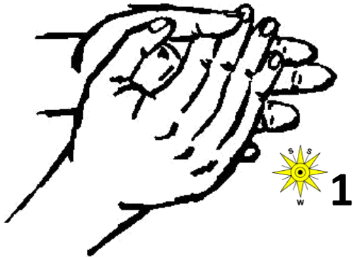
Handfläche auf Handfläche reiben, Handgelenke nicht vergessen!

Für Handreinigung und Hautpflege gilt der technisch gleiche Ablauf