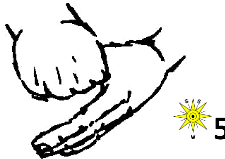
Daumen in der Handfläche reiben