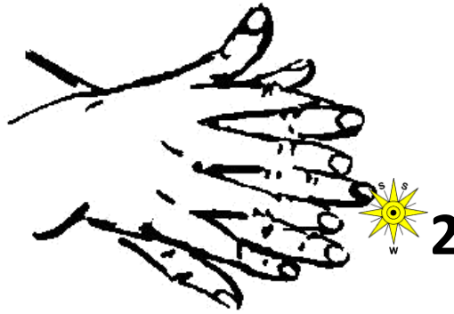
Handfläche über Handrücken und Fingerzwischenräume reiben.